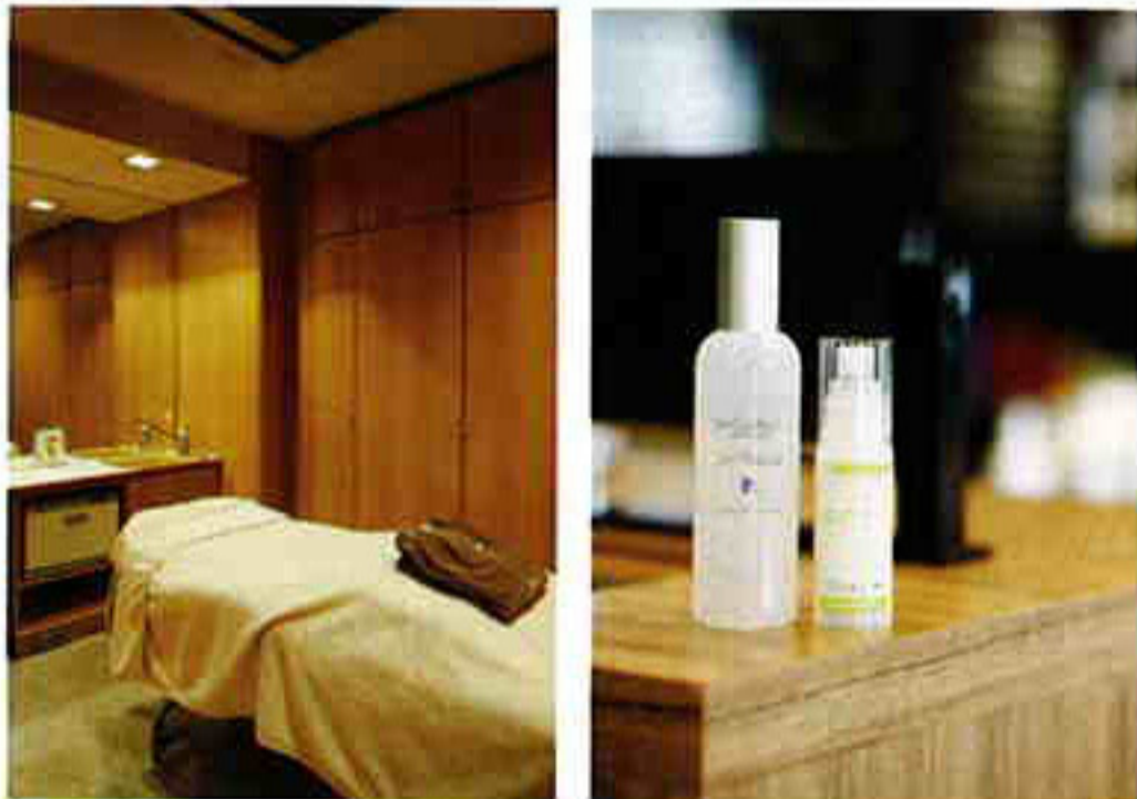
↑上・ショップスペースには、ヘア&ボディケアが中心の「オーストラリアンオーガニクス」も。下右・トリートメントは、「ドクターリンサクライ」と「ミュラド」を組み合わせ使用。下左・部屋はすべて個室。メイクリタッチのスペースもこの中に。

毛穴の悩みにてきめん！ 『ミュラド』のフェイシャル。 オープンして25年の老舗「サロンドクターリン」が、コスメショップを併設してリニューアル。トリートメントに、米国のドクターズブランド『ミュラド』を加えてパワーアップした。3種類あるフェイシャルの中でも、最初にトライしたいのがホルモンバランスの乱れに着目した「ハリサージェンスフェイシャル」。これまで培ってきたマッサージ技術と、肌を内側からふっくらさせるコスメのチカラで、頬周辺の毛穴が目立たなくなり、パーンとしたハリが生まれる。調子がアップダウンしやすい季節のコンディションニングにもおすすめ。