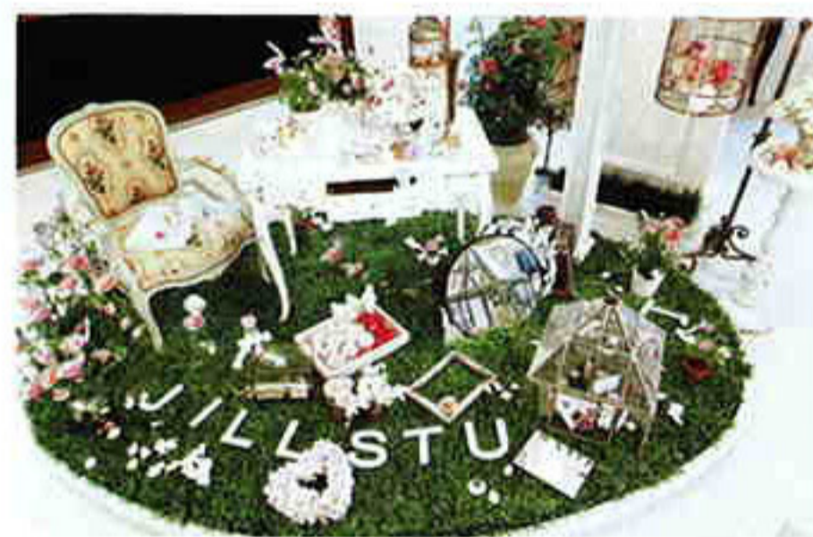
↑花咲く新チークをイメージしたスイーツでガーリーなディスプレイに、会場のあちこちからうっとりする声が。

頬で愛らしく花開くチークで、気分もハッピーに。 見た目も可愛いコスメで人気を集めるジルスチュアート。今回新たに発表されたのは、ルースタイプの新チーク。ヘアラッシュプロツサムの名のとおり、まるで花が開くようにふんわりと頬を染め上げてくれる。2色を重ね合わせることでツヤ、彩り、輝きを自在にコントロールでき、仕上りの美しさとなめらかな