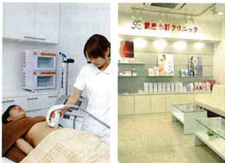
↑ウルトラアクセントは1エリア(10×10cm) 3万5800円。割引もあり。詳細はHPをチェック!

痛みもリバウンドもない痩身メニュー、上陸! おなじみ銀座小町クリニックに新しい痩身マシンが登場。「従来の超音波マシンの縦波は、脂肪を破壊するために血管や骨などまで傷つけてしまうことが多かった。でもこのマシンのシアウエーブという共振作用によるエネルギー増幅を利用して、痛みもなく脂肪細胞だけを破壊し、排出させることができる」と