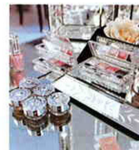
↑秋冬の新ラインナップもずらり。←ブラッシュ プロツサム全5種 各4725円。写真はシアーピンク×ロマンティックピンクのフェミニンな組み合わせ。

フィット感は感動もの。もちろん、花びらをモチーフにしたジュエリーのようなデザインも、女の子心をくすぐります。さらに、同時に登場する秋冬コレクションは、スモーキーカラーなどシックなテイストを取り入れることで、大人可愛さを演出。どちらも、ポーチにのびせるだけで幸せな気分にしてくれること請け合いです。